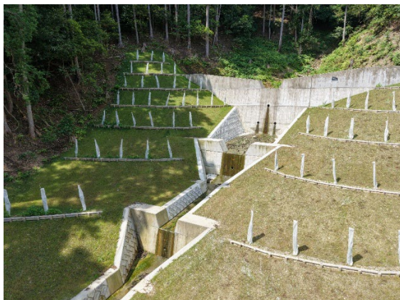
「生活道路を守る谷止工&流路工」 岐阜県大垣市 栗山和幸