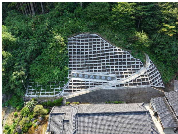
「法枠の新設完了」 新潟県長岡市 中村剛史