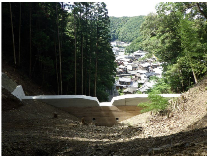
「港町を見守る治山ダム」 愛媛県愛南町 川村有希