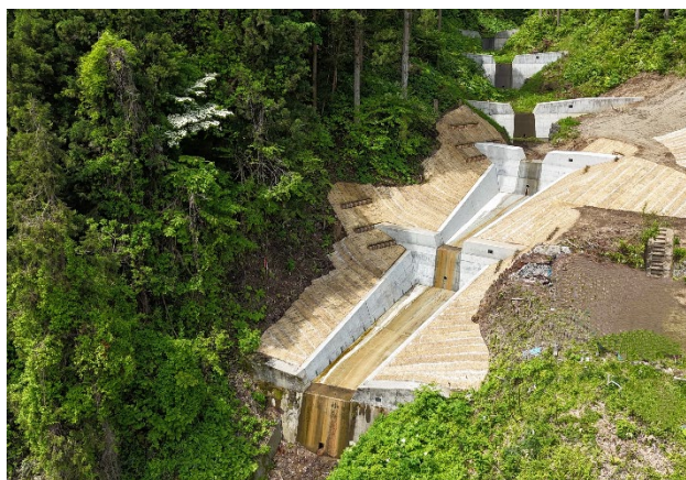
「令和6年度県営予防治山事業」 青森県八戸市 浅利勇太