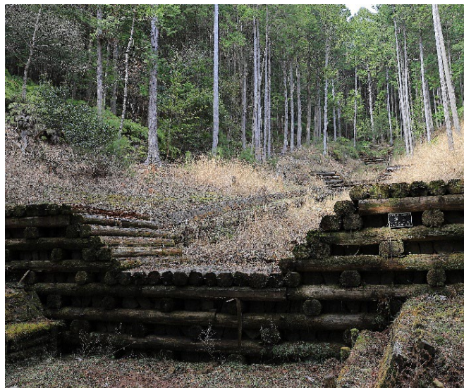
「木製の流路工」 愛知県清須市 増田興次