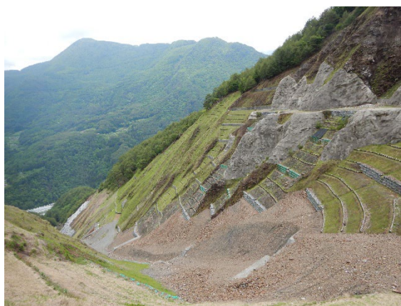
「山の治療」 長野県大鹿村 菅沼りりこ