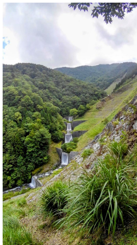
「新緑に映える堰堤群」 徳島県徳島市 濱田浩二