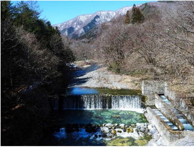
「雪解け水を湛えて」 千葉県柏市 糸賀一典