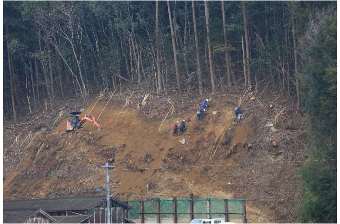
「農村を守る」 熊本県人吉市 迫田正純