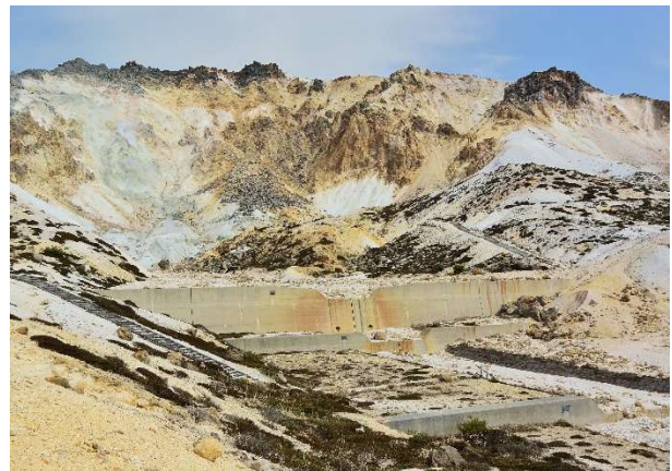
「火口のそばで」 北海道札幌市 山内崇司