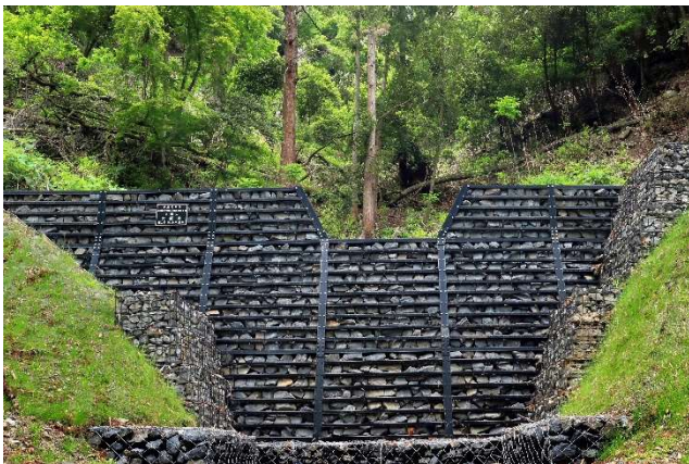
「強固な守り」 京都府八幡市 岡本一高