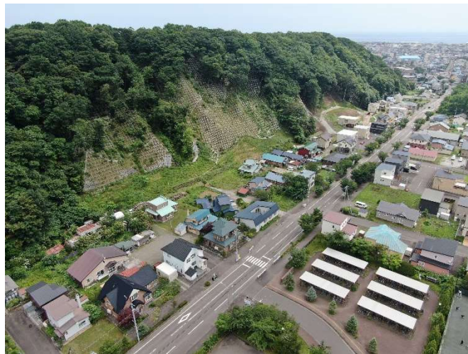
「治山事業と町並み」 北海道室蘭市 岩本侑大